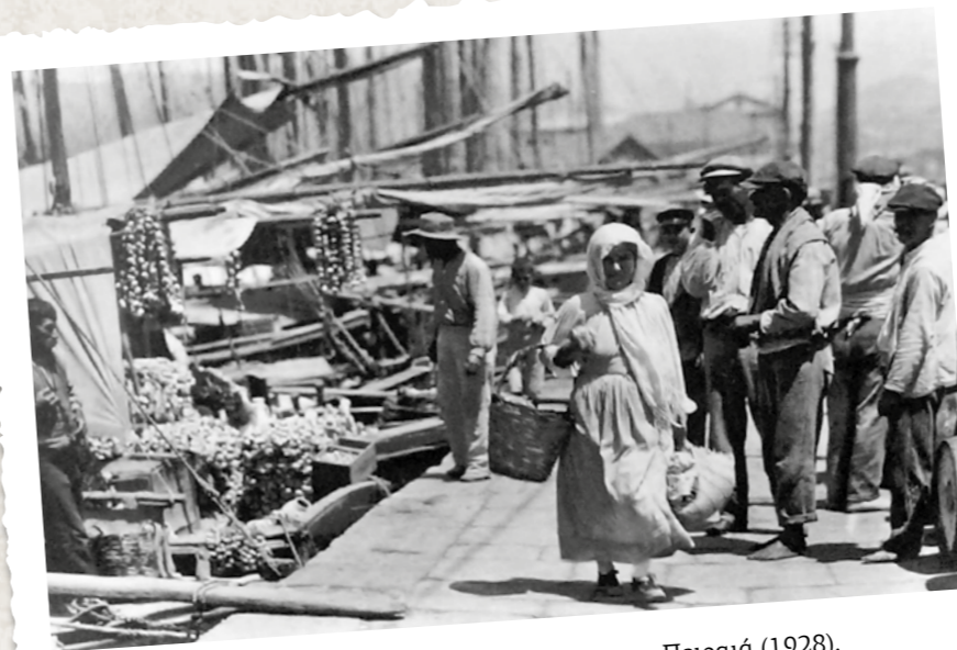
Καθημερινή σκηνή στις προκουμαίες του Πειραιά (1928).

Οι επαρχιώτες που κατέκλυζαν το «κέντρο» ήταν πάντα οι αγαπημένοι των γελοιογράφων («Τύπος», 1939).