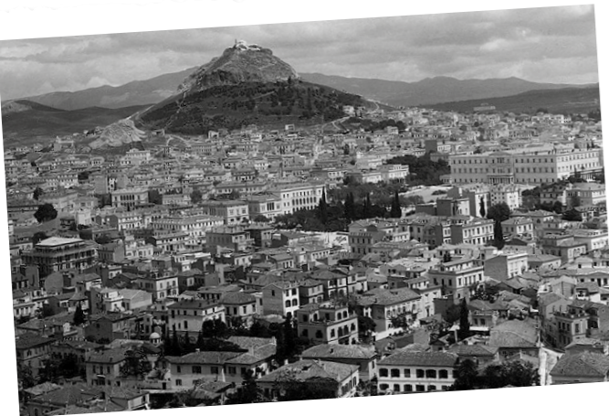
Η Αθήνα το 1906. Η ραγδαία της ανάπτυξη προκαλεί εντύπωση.