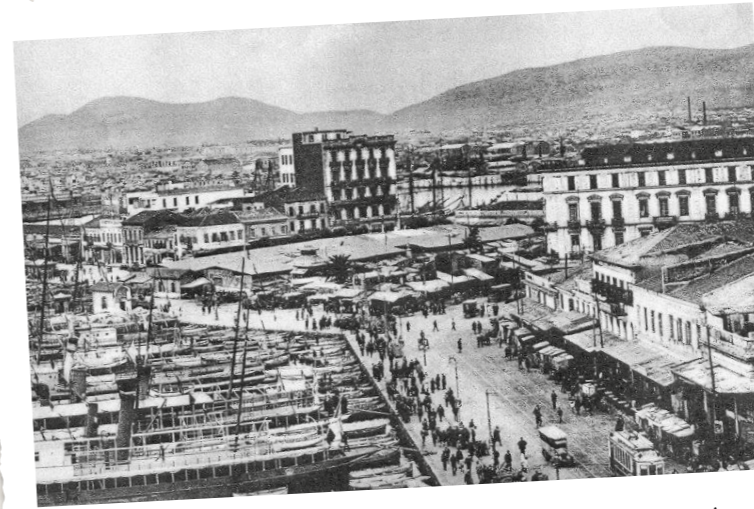
Η Ακτή Ποσειδώνος το 1930. Η ανάπτυξη του Πειραιά σε σχέση με τις προηγούμενες δεκαετίες είναι παραπάνω από εμφανής.