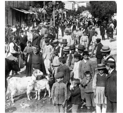
Για να μην ξεχνάμε και την ελληνική επαρχία, μια εικόνα από λαϊκή αγορά στη Σπάρτη (1907).