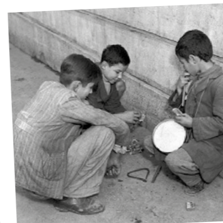
Ήταν μια εποχή που τα παιδιά έτρεχαν στους δρόμους χωρίς φόβο. Ακόμα και η μοιρασιά των εισπράξεων από τα κάλαντα γινόταν ανέμελα.