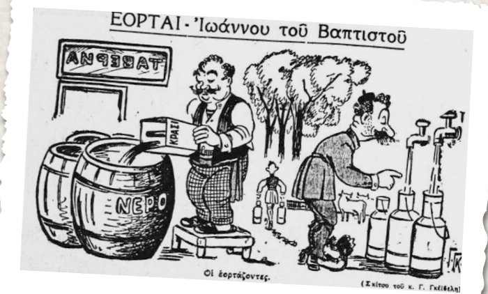
Του Αϊ-Γιάννη του Βαπτιστή και κάποιοι «επαγγελματίες» έχουν την τιμητική τους... («Ο Τύπος», 1939)