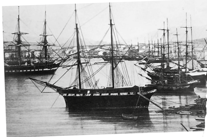
Ο Πειραιάς με τα ιστιοφόρα του (1852).