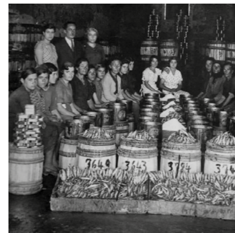
Στην Καλλονή της Λέσβου η σαρδέλα ξεχειλίζει φρέσκια φρέσκια απ' τα βαρέλια.

ΤΑ ΤΡΑΓΟΥΔΙΑ ΤΗΣ ΓΕΙΤΟΝΙΑΣ Ο ΦΩΤΟΓΡΑΦΟΣ Κικούβγα κι' άσπλαγνη Κική, τά μάτια σου είνε σαν φακούς. Βάλε στην πάντα την αιδώ, πόζαρε λίγο νά σε δώ, άι! κι' άσε τός περιστροφάς κι' έξγα και κούτα με ά ν φ ά ς. Ο ΠΕΡΒΟΛΑΡΗΣ Ρέ θείο άγγελουδι μου, τί μου φουρκίζεσαι; έσύσαι τό λουλουδι μου, τ' ά ν θ ί ζ ε σ α ; ; Δέ θέλω νά κικιώνουμε νά μου πικραίνεσαι, κι οί δυό μ'ις νά μ'αλώνουμε γιατί μα ρ α ί ν ε σ α τ' ! .. Ο ΦΟΥΡΝΑΡΗΣ Φρατζόλα είσ' έφτάζυμη, γιομάτη γουστιμάδα, μά μ'άμπλεξες με φούναρη κ'ι θάγγης... πα ξ ι μ ά δ α .