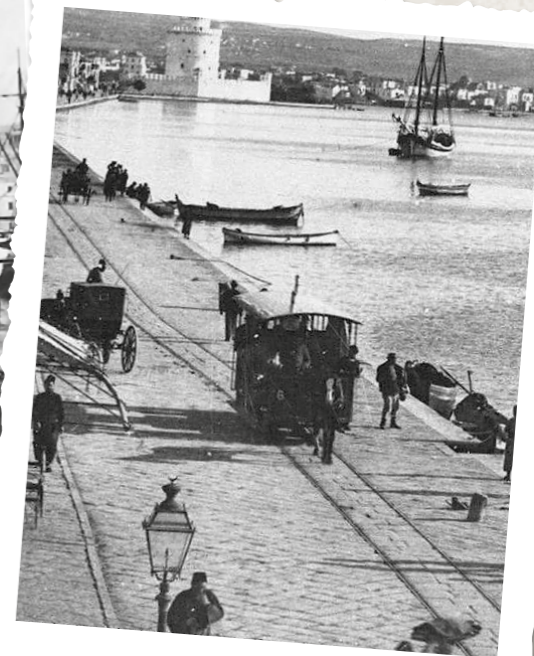
Η ωραία Θεσσαλονίκη στα τέλη του 19ου αιώνα με έναν «αγνωρίστο» αλλά καλά οχυρωμένο Λευκό Πύργο.