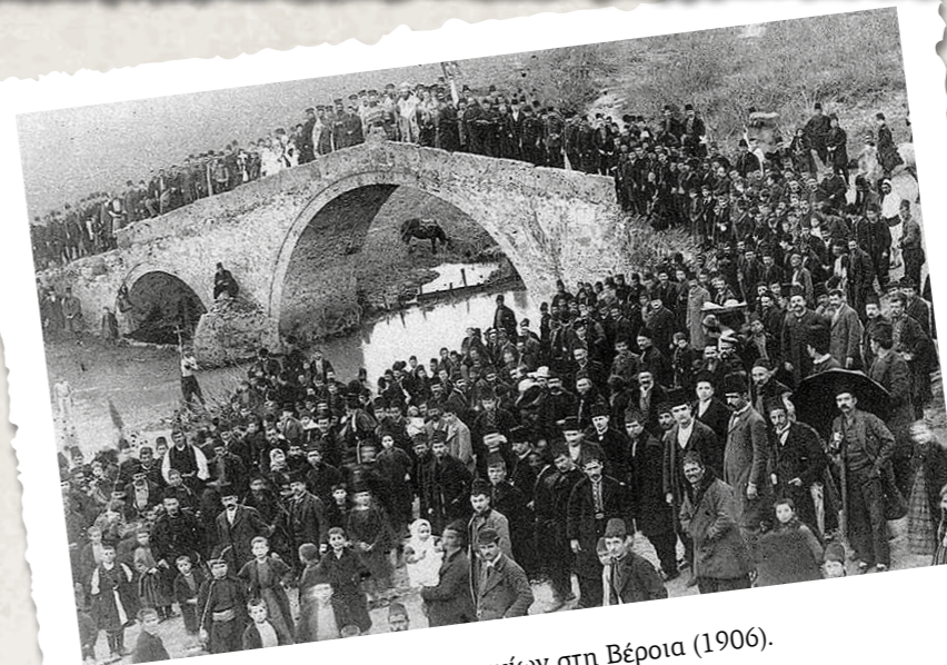
Γιορτή των Θεοφανίων στη Βέροια (1906).