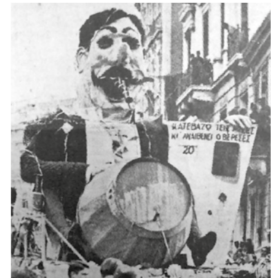
Απόκριες του 1934. «Κατεβάζω τις μισές κι' ανεβαίνει ο βερεσές» τραγουδά ο κόσμος ανέμελα στους δρόμους.

Ερωτικά τραγούδια... της γειτονιάς. Του Αγίου Βαλεντίνου γαρ.