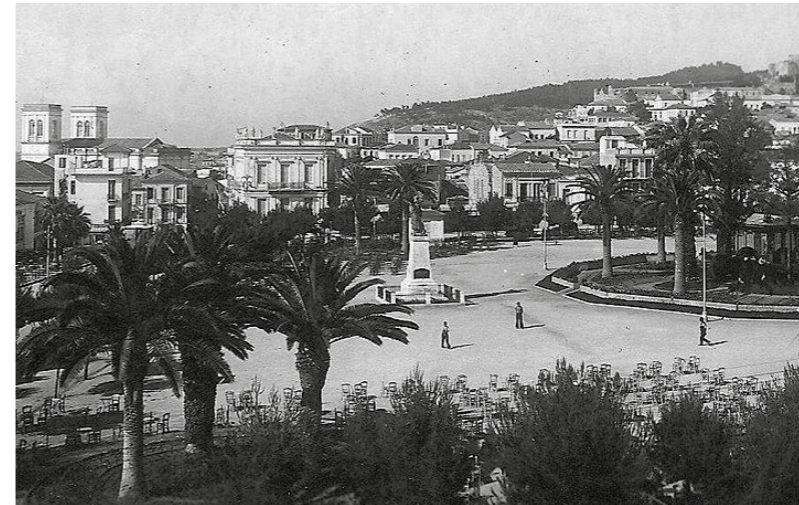
Η Πάτρα με τα «Ψηλά Αλώνια» της.