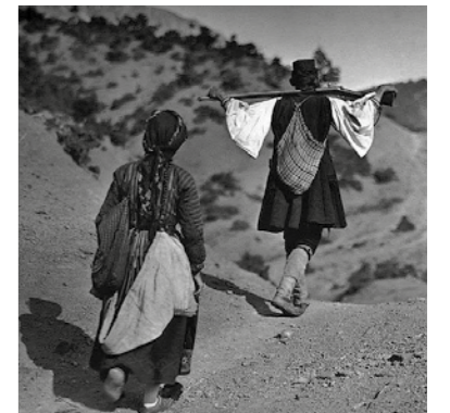
Χαρακτηριστική εικόνα της καθημερινότητας της ελληνικής επαρχίας.