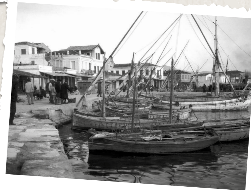
Ἡ χειμωνιάτικη Αἴγινα κάπου το 1930.