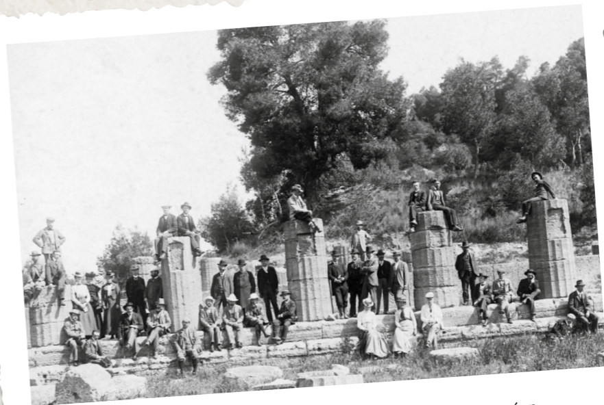
Εκδρομείς στην Ολυμπία. Η φύλαξη των μνημείων αφημένη στον πατριωτισμό των Ελλήνων. Κατά τα άλλα κοστούμι, καπέλο και γραβάτα δίνουν τον τόνο (1901).

(κείμενο της εφημερίδας «Αθηναϊκός Αστήρ», 1896)