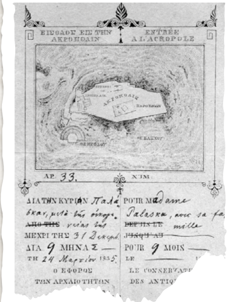
Μια σπάνια απεικόνιση «εισιτηρίου» για το μνημείο της Ακρόπολης (1835).