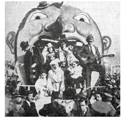
Απόκριες του 1934 και τα «άρματα» βγήκαν στους δρόμους...